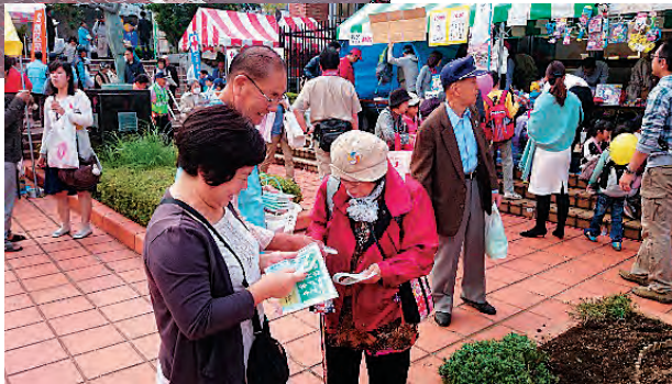
PR活動の様子 (写真上下)

売やイベントが行われており、たくさんの方で賑わっていました。当センターも数カ所の出入口に配布場所を設置し、会員、職員一丸となって入会・発注のチラシとポケットティッシュの配布を行いました。