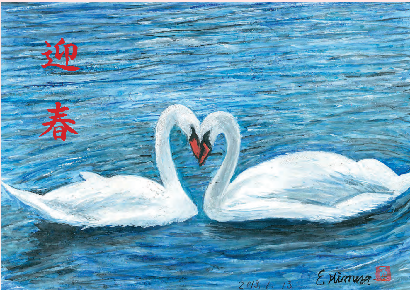
皇居お堀の白鳥 木村 勇 会員 画/書 高木かほる 会員