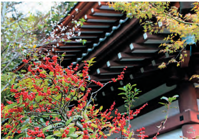
【長谷寺と梅もどき】 高野 裕昭 北部会員