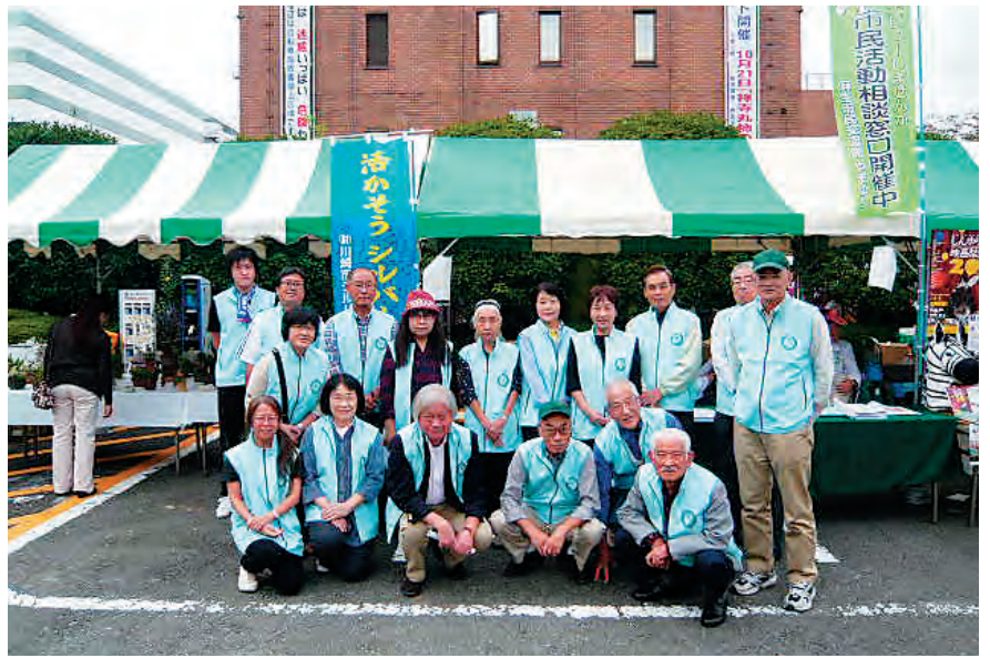
あさお区民まつり

を配布し、多くの来場者にPRができました。興味をもたれた来場者には、センターの仕組み、会員登録と、お受けできる仕事の案内を行いました。今後も地域の方へ、シルバー事業の広報活動を行ってまいります。 ◎家事援助・子育て支援サービスに携わる会員を募集 家事援助・子育て支援サービスの依頼が増加しています。関心と意欲の有る会員の方の募集をしています。是非事務所までご連絡下さい。