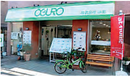
株式会社小黒（外観）

シルバー人材センターに依頼した「キツカケ」は、他の業者が清掃をシルバー人材センターに委託している話しを聞いたことで、お願いしてから10年以上経ちます。委託件数も徐々に増えてきて、建物によって清掃周期がバラバラなので、会員の取り纏めと不時の