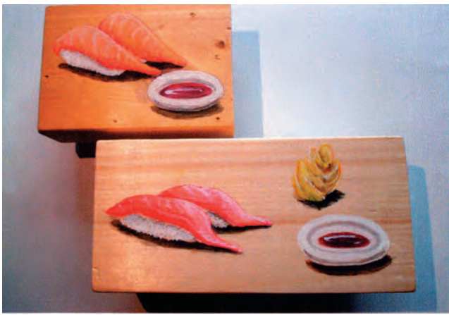
【握りおまちどー】 三浦 祐 南部会員 (無垢の木に直接描いた)