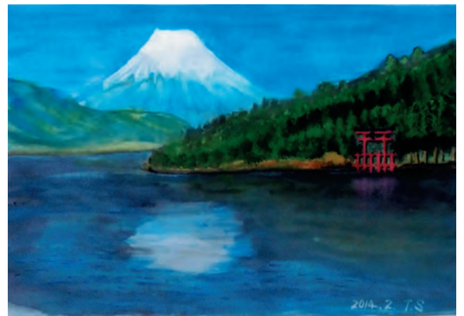
【富士と芦ノ湖】 佐竹 敏之 中部会員