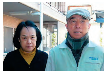
清掃作業の森会員夫妻

いつも一緒にいるのでどうということはない。始めの2年間は二人で作業をしていたが、その後は1人で2日間交代でしている。夫婦で働くメリットは、体の具合が悪いときなどは気軽に交代してもらえるので気兼ねなく休めること。二人で3年間1日の穴もあけることはなかったです。