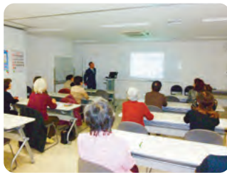
交通安全講習会の様子