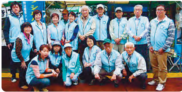
あさお区民祭でのPR