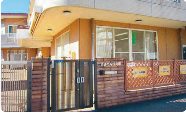
あさのみ保育園の入口

あさのみ保育園ではシルバー人材センターの仲間はベテランの方で3年半くらい働いています。現在、4名の女性会員が登録され、2名体制で13時～15時の園児のお昼寝の時間に共通ホールや廊下などを清掃されています。日曜日と祝日はお休みです。