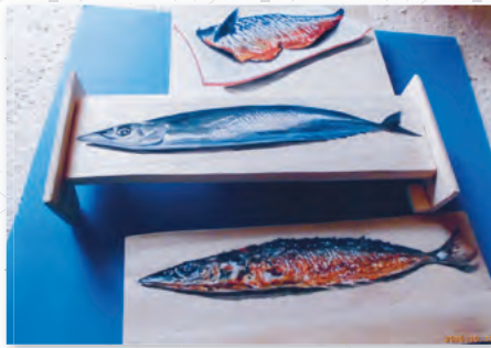
【無垢板に描いた 美味そうな魚】 三浦 祐 会員