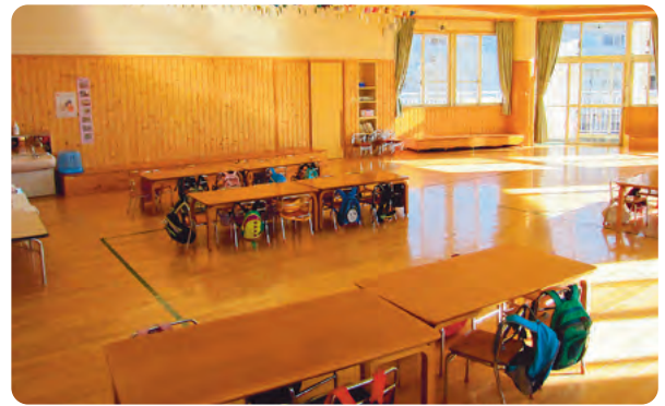
清掃作業対象の2階のホール

当園では、この周辺が東京のベッドタウンであることを反映して、お子様を預かる時間が10時間以上になることがあります。そのため午前7時～午後8時（2時間延長を含む）の時間帯でお客様をお預かりしています。