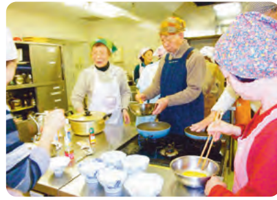
昨年の講習会風景

調理を基礎から学べる、初心者向け簡単健康調理講習会を開催します。調理経験のない男性でも気軽に参加できる講習会です。市内在住で60歳以上の方であればどなたでも応募できます。お知り合いの方など、お誘いのうえご参加ください。